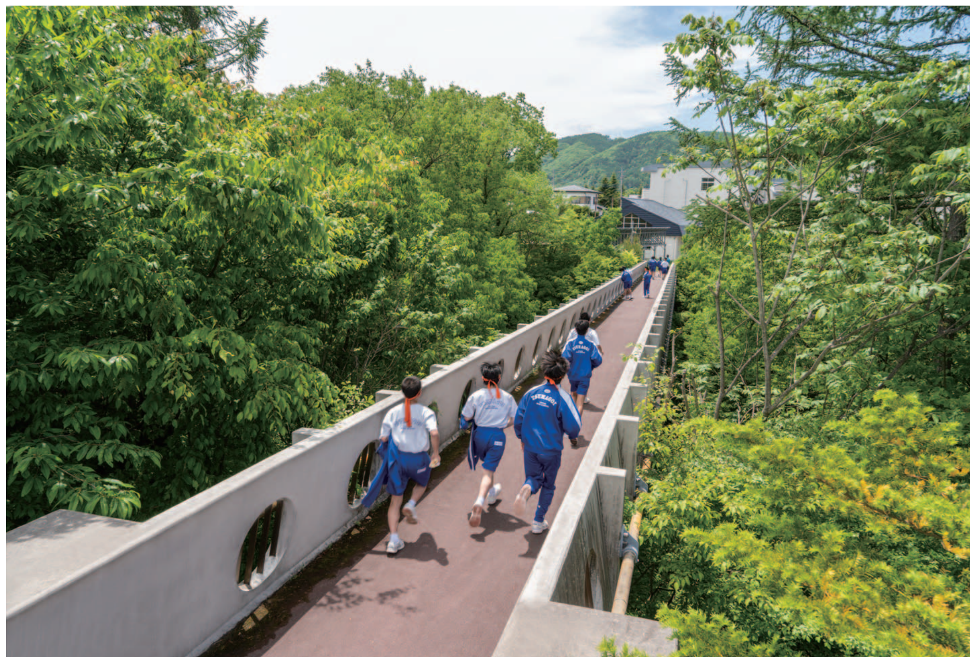
Seishun Bridge Tsumagoi Village, Gunma Prefecture, Japan