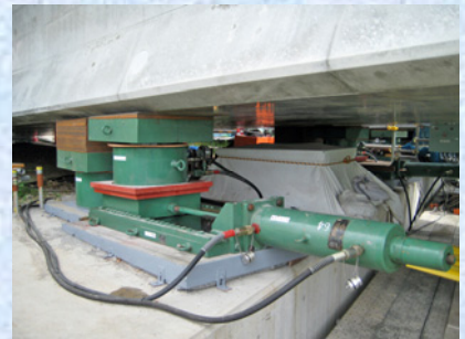
ARC工法押し出し装置