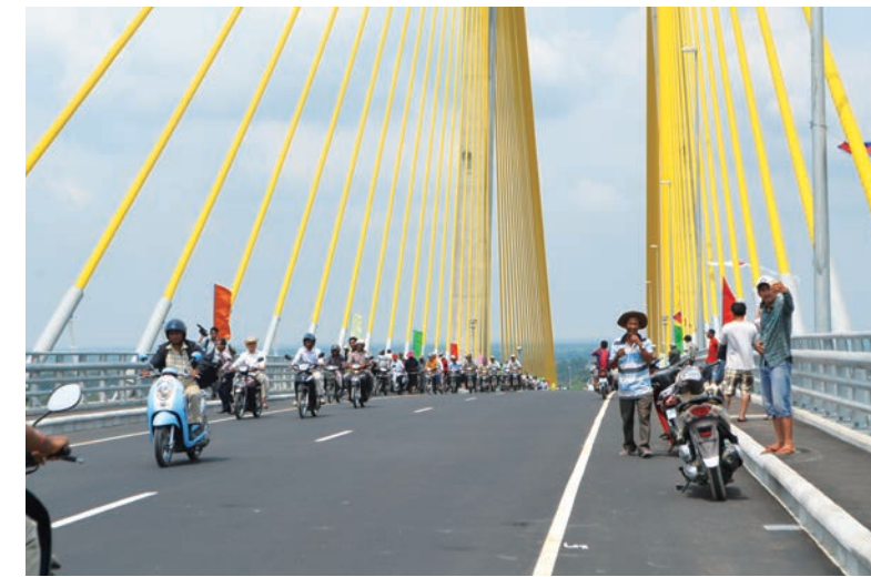
橋の上には恋人たちが集まり、観光バスが止まる。付近には店舗もでき、地元の名所になっている。

二羽の鳥の翼を模した「つばさ橋」。まるで手を取り合うように、熱い想いをつなげている。