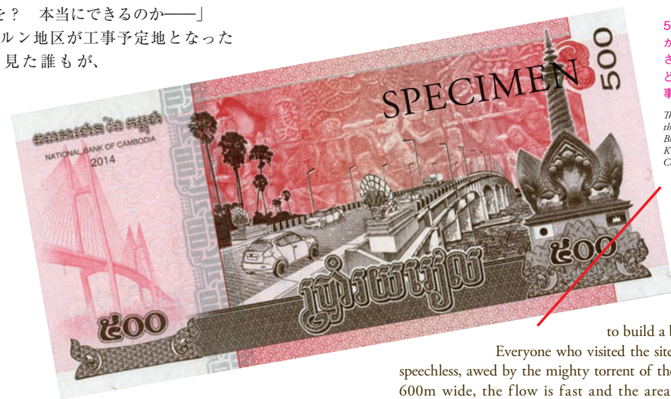
500 リエルの紙幣の左側に描かれている斜張橋が「つばさ橋」、右側が「きずな橋」。どちらも三井住友建設が工事を担当した。 The cable-stayed bridge on the left of the 500-riel banknote is the Tsubasa Bridge and the one on the right is the Kizuna Bridge. Sumitomo Mitsui Construction built both bridges.

「ここに橋を? 本当にできるのか——」 ネアックルン地区が工事予定地となった時、現場を見た誰もが、メコン川