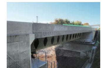
全長26.5mの別壱谷橋。比較的短い橋で工事を行い、Dura-Bridge (デュラブリッジ)の施工面、コスト面、安全面での課題を確認しています。将来的には、300~500m級の橋への展開を目標としています。

Deterioration in the structural integrity of bridges is an important social issue for which an effective response is required. Steel bars used for reinforcing concrete are one of the causes of deterioration of concrete bridges. Antifreeze agent used in winter and salty air blowing in from the ocean cause corrosion of rebars, speeding deterioration of bridges. In cooperation with West Nippon Expressway, we developed Dura-Bridge technology that uses a novel corrosion-free material instead of rebars or prestressing steel strands. Bessodani Bridge on the Tokushima Expressway, the first expressway bridge adopting Dura-Bridge, was completed in December 2020. We will promote wider application of this technology to structures subject to harsh corrosive environments.