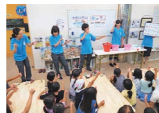
夏のリコチャレ「しずみいランドへGO!」では、当社の技術職社員が講師役となり、小学生の女子児童にもものづくりの楽しさと建設業の魅力を伝えました。

In line with ongoing technological innovation and globalization, the construction industry needs the wide-ranging perspectives and flexible thinking that only diverse human resources can offer. Therefore, we are vigorously promoting women, people from other countries, the elderly, and people with disabilities to create a corporate culture where people can choose from diverse work styles. We are also an active partner of the Riko Challenge (Riko-Challe) initiated by the Gender Equality Bureau of the Cabinet Office to encourage female youngsters to focus on science, technology, engineering and mathematics (STEM).