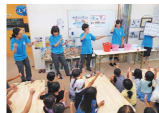
夏のリコチャレ「しずみいランドへGO!」では、当社の技術職社員が講師役となり、小学生の女子児童にもものづくりの楽しさと建設業の魅力を伝えました。

In line with ongoing technological innovation and globalization, the construction industry needs the wide-ranging perspectives and flexible thinking that only diverse human resources can offer. Therefore, we are vigorously promoting women, people from other countries, the elderly, and people with disabilities to create a corporate culture where people can choose from diverse work styles. We are also an active partner of the Riko Challenge (Riko-Challe) initiated by the Gender Equality Bureau of the Cabinet Office to encourage female youngsters to focus on science, technology, engineering and mathematics (STEM).