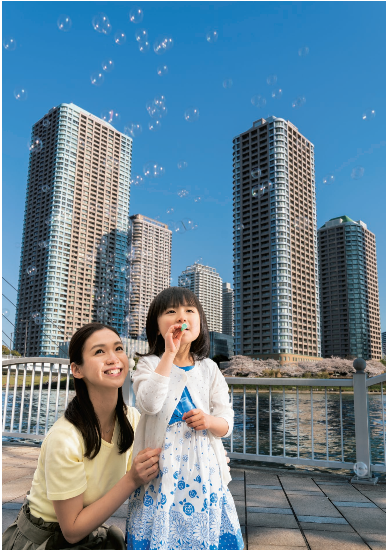
River City 21 Tsukuda, Chuo-ku, Tokyo, Japan

In the 1960s it was considered impossible and reckless to build skyscrapers in the earthquake-prone country of Japan. To use space efficiently for urban residences and to respond to people longing for panoramic skylines, our engineers have been challenging and finally achieved numerous innovations in structural design, new materials, and seismic isolation. We constructed Japan's first 40-story condominium building, which became a symbol of contemporary urban life, influencing subsequent community development. We will continue building a brighter future.