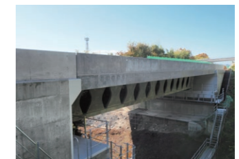
全長26.5mの別壱谷橋。比較的短い橋で工事を行い、Dura-Bridge (デュラブリッジ)の施工面、コスト面、安全面での課題を確認しています。将来的には、300~500m級の橋への展開を目指しています。

Deterioration in the structural integrity of bridges is an important social issue for which an effective response is required. Steel bars used for reinforcing concrete are one of the causes of deterioration of concrete bridges. Antifreeze agent used in winter and salty air blowing in from the ocean cause corrosion of rebars, speeding deterioration of bridges. In cooperation with West Nippon Expressway, we developed Dura-Bridge technology that uses a novel corrosion-free material instead of rebars or prestressing steel strands. Bessodani Bridge on the Tokushima Expressway, the first expressway bridge adopting Dura-Bridge, was completed in December 2020. We will promote wider application of this technology to structures subject to harsh corrosive environments.