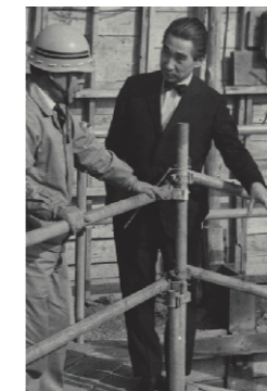
建築中に現場を見てまわる丹下健三氏。 Kenzo Tange visiting the site during construction

Extracting a 2-ton concrete block. The hydraulic jacks supporting the building were adjusted with 1mm precision to minimize structural stress.