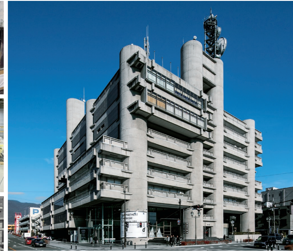
丹下健三氏が提唱したメタボリズム（新陳代謝）＝「成長する都市や建築」の代表作と言われている。

Considered a masterpiece of Metabolism, a movement fusing architectural structures with ideas of organic biological growth.