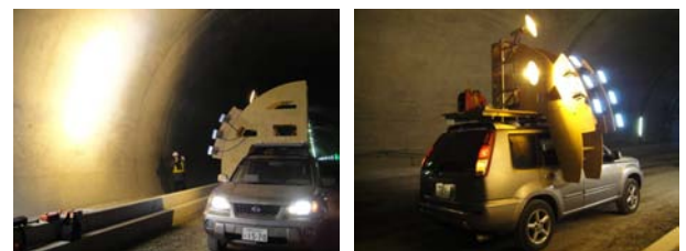
写真-1 トンネル画像計測車両（試作版）

Crack Detection using Shade or Color Space by Floodlight