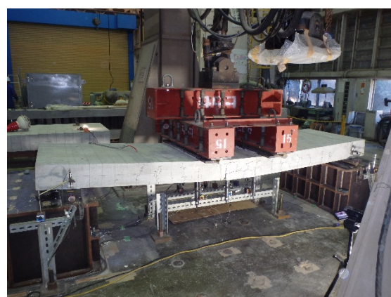
写真-2 継手部を有する試験体の静的曲げ載荷実験