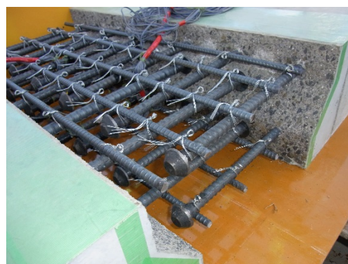
写真-1 拡径鉄筋継手

高度成長期に建設された鋼橋上の RC 床版の多くは老朽化が著しく、現在、各事業主体による大規模修繕計画の中でその取替え工事が順次実施されている。プレキャスト PC 床版の継手には、ループ継手が一般的に用いられるが、床版厚さの制約やループ内の鉄筋配置が面倒などの欠点を有する。著者らはこれらを改善する方法として、先端を拡径加工した鉄筋を用いた継手構造を開発した（写真-1）。本研究では、継手部の曲げ試験を実施し、本継手構造がループ継手と同等の性能を有していることを確認した。