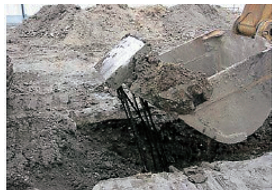
写真-1 基礎撤去状況

The Development of a Simple Foundation System using Steel Bars