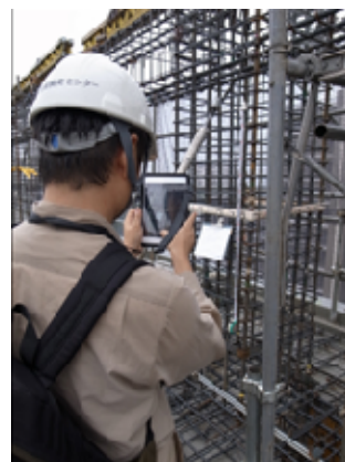
写真-1 配筋検査状況

2014年11月より実務運用を開始し、これまでおよそ1年半で5支店31作業所において本システムを導入している。開発前に行った検証において配筋検査、配筋写真撮影管理業務に対するICT導入による省力化効果は従来の紙ベースのやり方に比べて約43%と推定されたが、導入後作業所に行ったヒアリングにおいても、所期の効果を発揮しているようである。一方で展開に伴い様々な機能改善要望が出ており、継続的に改善を行うことでより使いやすいものにしていく考えである。