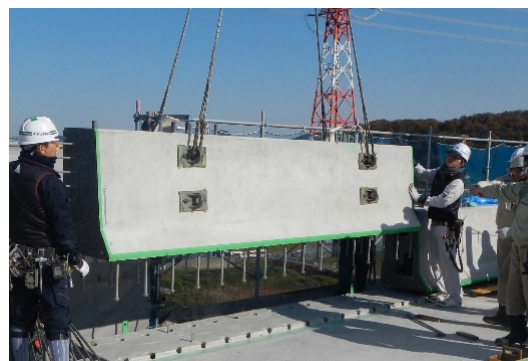
写真-2 実橋に適用したプレキャスト壁高欄