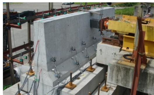
写真-1 プレキャスト壁高欄の衝突試験