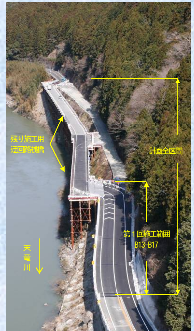
第1回工事竣工全景