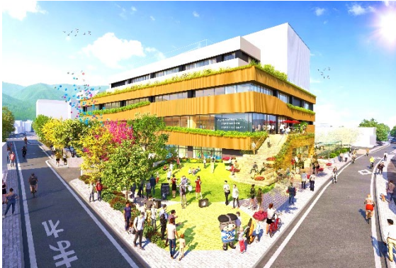
施設正面イメージ