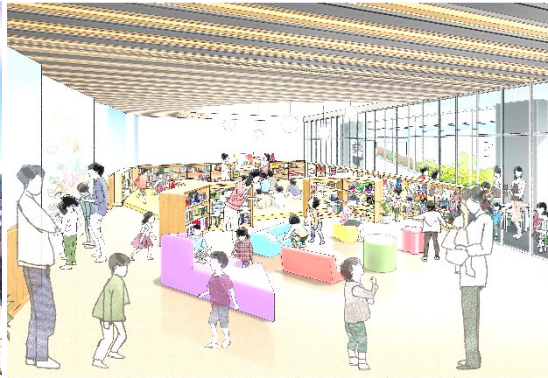
図書館こどもスペースイメージ