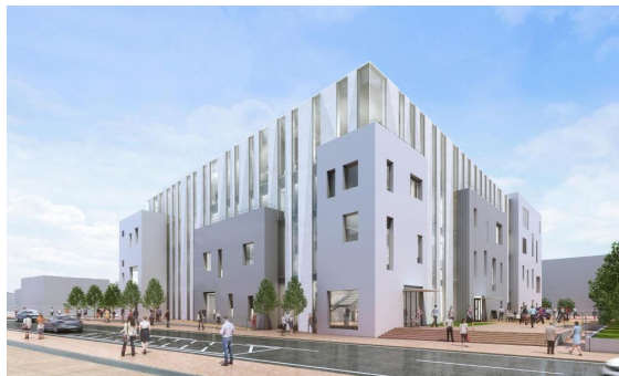
(仮称) 西地域文化施設イメージ