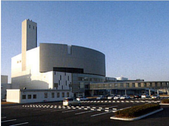
エコパークあぼし外観