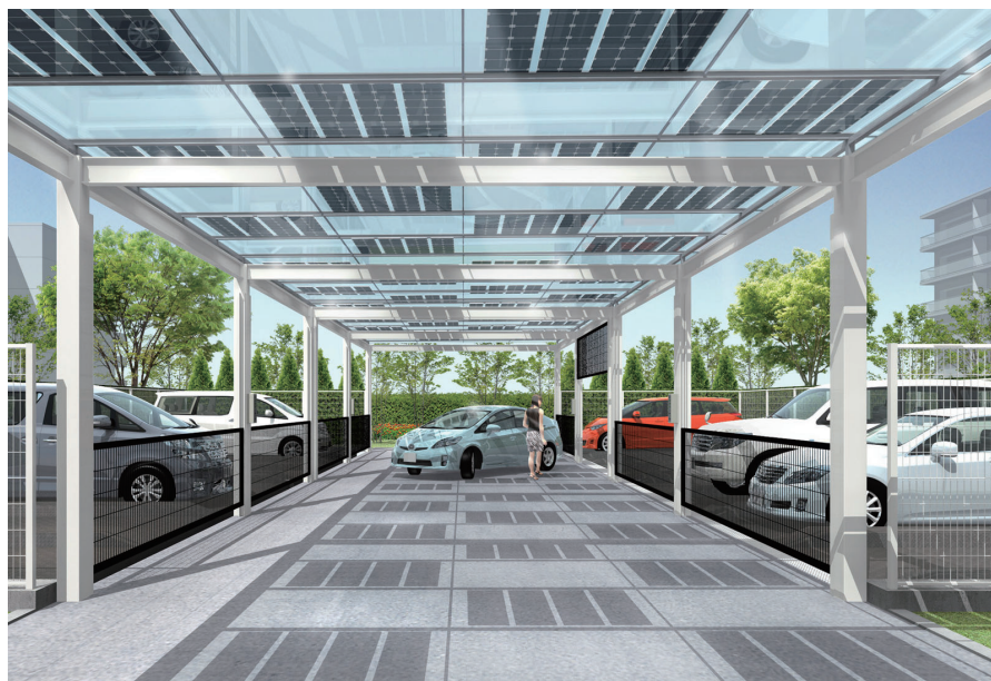
キャンピーパーキングのイメージ