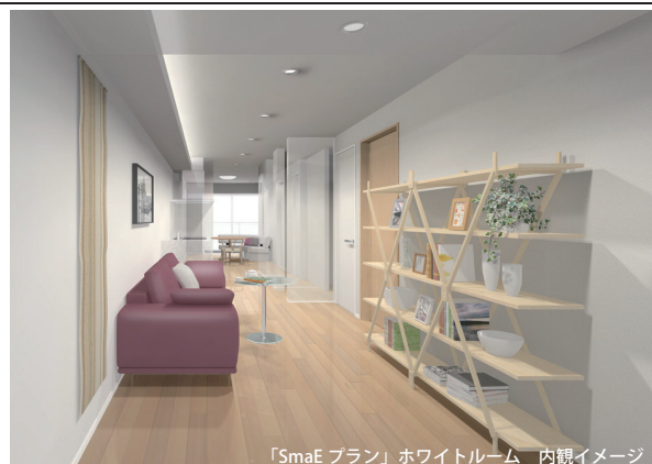
「SmaE プラン」ホワイトルーム 内観イメージ