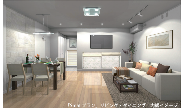
「SmaI プラン」リビング・ダイニング 内観イメージ