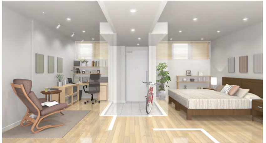
■玄関側居室イメージ