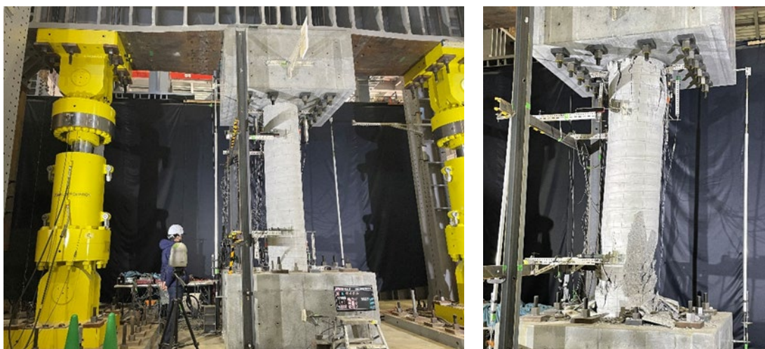
【高強度鉄筋を用いた杭体の構造性能確認実験状況】

本技術は、これまで場所打ち杭の主筋に用いられていた鉄筋(降伏点強度が 490N/mm 2 以下の鉄筋)よりも高い強度の鉄筋(降伏点強度が 590~685N/mm 2 の鉄筋)を主筋として用います。これまで高強度鉄筋を場所打ち杭の主筋として用いた実績がなく、前記課題を解決するために、高強度鉄筋を杭主筋に採用した場合の各種実験を実施し、設計手法を確立しました。