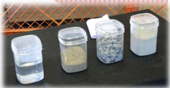
高強度コンクリートとは！？

女子中高生・女子学生の皆さんはもちろん、男子学生、保護者の方々や学校の先生も、ぜひ参考にしてください。