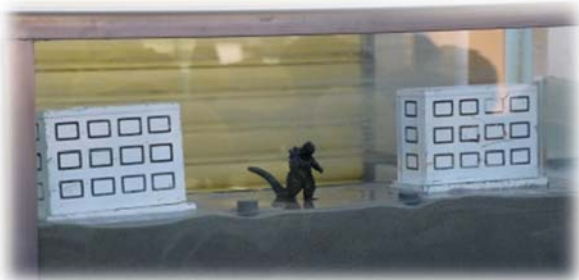
地震時の液状化の仕組み！